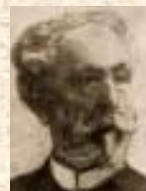
LALO EDOUARD 1823 - 1892