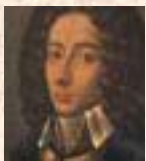
PERGOLESI GIOVANNI BATTISTA 1710 - 1736