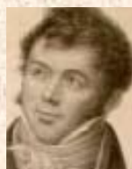
SOR FERNANDO 1778 - 1839