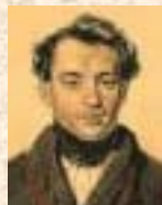
STRAUSS JOHANN 1825 - 1899