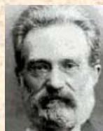
SMETANA BEDRICH 1824 - 1884