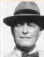
IBERT JACQUES 1890 - 1962

Ambrosian Singers Orch. Concertgebouw d'Amsterdam Neville Marriner Philips