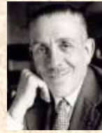
POULENC FRANCIS 1899 - 1963