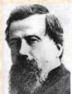
PONCHIELLI AMILCARE 1834 - 1886

Stabat Mater Lucia Valentini-Terrani (c) Ileana Cotrubas (s) I Solisti Veneti Claudio Scimone Erato