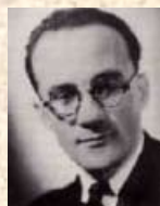
SKALKOTTAS NIKOS 1904 - 1949

Orch. Symph. de la Radio-Télévision de l'URSS Guennadi Rojdestvenski Chant du Monde