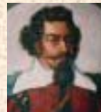
PRAETORIUS MICHAEL 1571 - 1621

Gloria Judith Blegen (s) Ch. de Westminster Orch. Phil. de New York Leonard Bernstein CBS