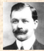
LEHAR FRANZ 1870 - 1948

Pierre Amoyal (violon) Orch. Opera Monte-Carlo Paul Paray Erato