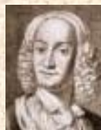
VIVALDI ANTONIO 1678 - 1741