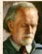
KODALY ZOLTAN 1882 - 1967