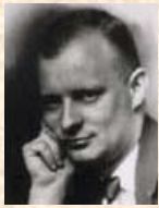
HINDEMITH PAUL 1895 - 1963