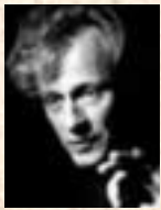
PENDERECKI KRZYSTOF 1933 -