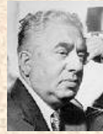
KHATCHATURIAN ARAM 1903 - 1978