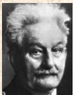
JANACEK LEOS 1854 - 1928

Orch. Phil. de New York Leonard Bernstein CBS